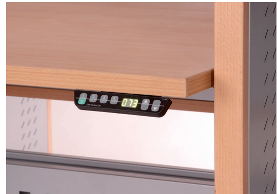
Auf Knopfdruck wählen Sie Ihre individuelle Arbeitshöhe im Sitz-Stehbereich.

Marathonsitzungen am Schreibtisch bleiben oft nicht folgenlos: Schnell beginnen Nacken, Rücken und Handgelenke zu schmerzen. Doch es geht auch anders: Mit T-Delta Silencio Duo bringen Sie Dynamik in Ihren Arbeitsablauf und vermeiden monotone Bewegungsabläufe. Auf Knopfdruck verstellen Sie T-Delta stufenlos und flüsterleise zwischen 60cm und 120cm. So verwandeln Sie spontan Ihren Schreibtisch in ein Stehpult und wählen dabei die für Sie optimale Arbeitshöhe . Passen Sie T-Delta an Ihre Körpergröße und Ihre Bewegungsbedürfnisse an! Selbstverständlich lässt sich jeder der beiden Plattenträger eines Moduls individuell einstellen. Durch die patentierte Seilzugtechnik, hochwertige Materialien und einer ausgezeichneten Verarbeitung überträgt die Höhenverstellung keine störenden Schwingungen an Nachbartische. T-Delta - das ist Arbeitsdynamik in völlig neuer Dimension!