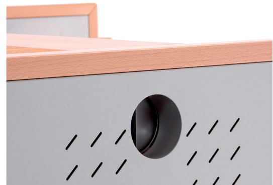
Die clevere Kupplung ermöglicht beliebige Modulkombinationen.

Orientierung hin zur Teamarbeit und dem „Management by Walking Around“ lässt das Konzept Großraumbüro eine Renaissance erfahren. Doch der Arbeitsplatz Großraumbüro erfordert neue Überlegungen in Hinblick auf Ergonomie und Design . So mangelt es im Großraumbüro an Rückzugsmöglichkeiten für ein konzentriertes Arbeiten. Raumteiler schaffen Abhilfe, indem sie visuelle und akustische Reize dämmen. Damit stehen sie jedoch dem Konzept des offenen Raumes entgegen und verursachen hohe Kosten. T-Delta Silencio Duo gelingt es durch sein einzigartiges Design Trennwände direkt in den Schreibtisch zu integrieren , um visuelle und akustische Reize zu filtern . Das offene Raumklima bleibt dabei erhalten. T-Delta Silencio Duo ermöglicht ein konzentriertes Arbeiten , fördert jedoch zugleich Bewegung und Kommunikation.